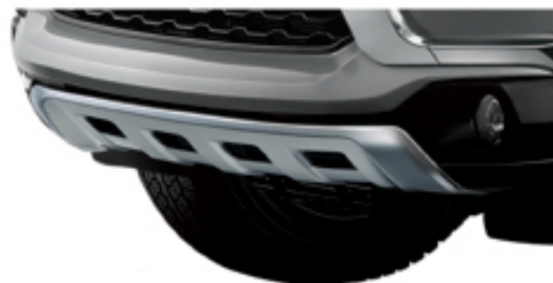
FRONT UNDER GARNISH