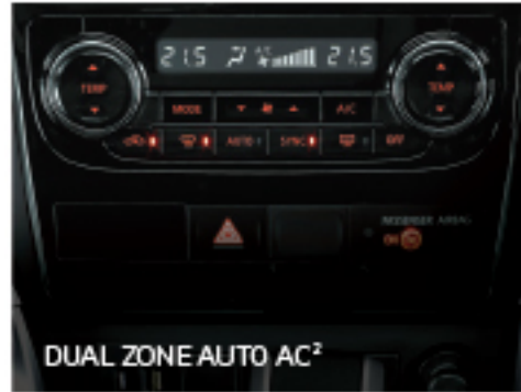
DUAL ZONE AUTO AC 2