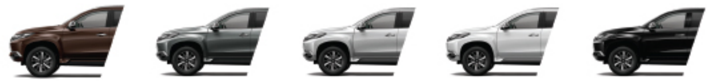
Deep Bronze Metallic** Titanium Gray Metallic** Sterling Silver Metallic Quartz White Pearl/White Pearl*** Diamond Black Mica

catatan: spesifikasi ini adalah referensi saja, penyesuaian bisa saja terjadi.