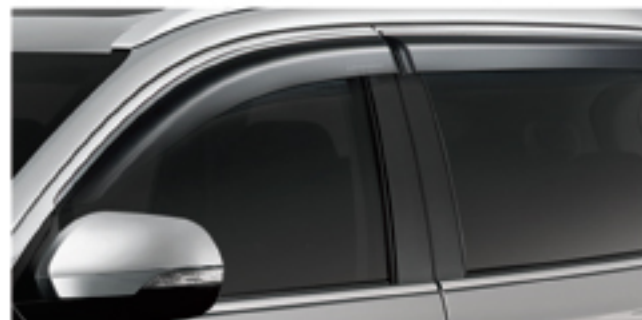
SIDE WINDOW DEFLECTOR

Berani beda dengan menambahkan beberapa sentuhan baru dengan aksesoris orisinal yang semakin merefleksikan karakter Anda sebagai sang penjelajah sejati.