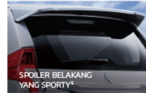
SPOILER BELAKANG YANG SPORTY 5