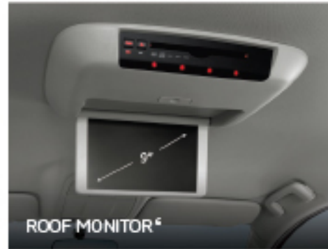
ROOF MONITOR 6