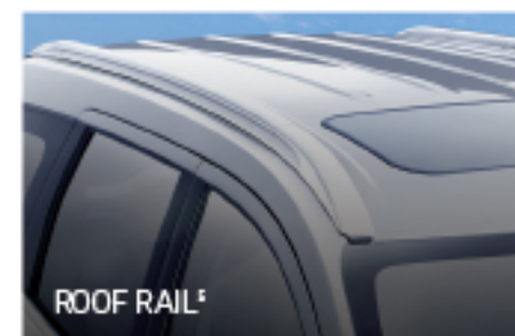
ROOF RAIL 4