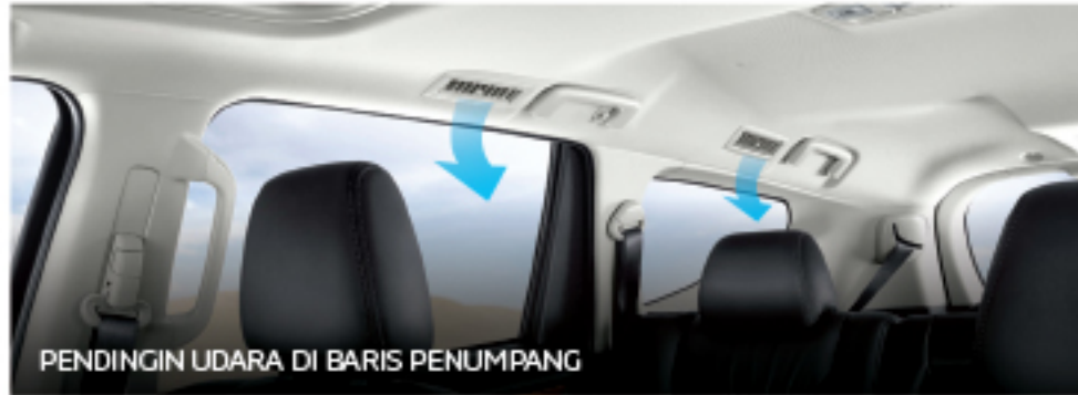
PENDINGIN UDARA DI BARIS PENUMPANG