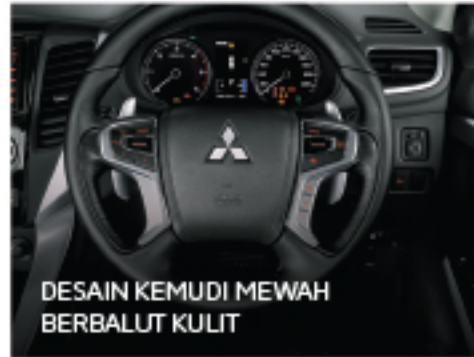
DESAIN KEMUDI MEWAH BERBALUT KULIT