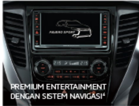
PREMIUM ENTERTAINMENT DENGAN SISTEM NAVIGASI 4