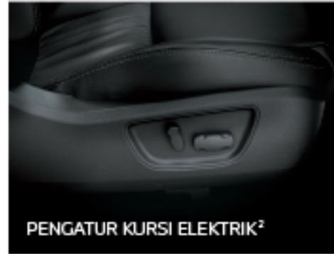
PENGATUR KURSI ELEKTRIK 2