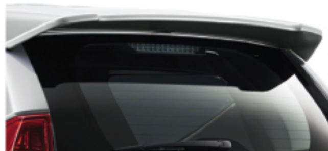
TAIL GATE SPOILER