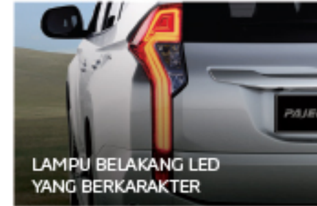
LAMPU BELAKANG LED YANG BERKARAKTER

Semakin mewah dan berkelas dengan warna klasik black piano membuat perjalanan Anda dan keluarga lebih eksklusif.