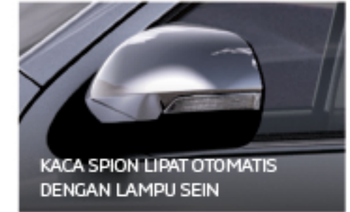
KACA SPION LIPAT OTOMATIS DENGAN LAMPU SEIN