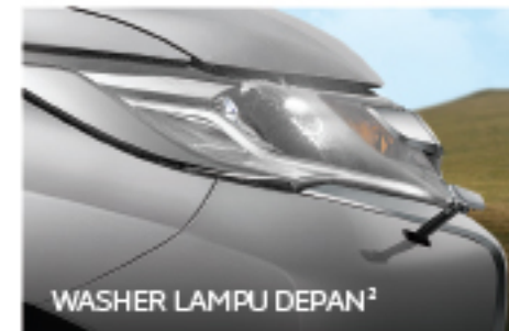
WASHER LAMPU DEPAN 2