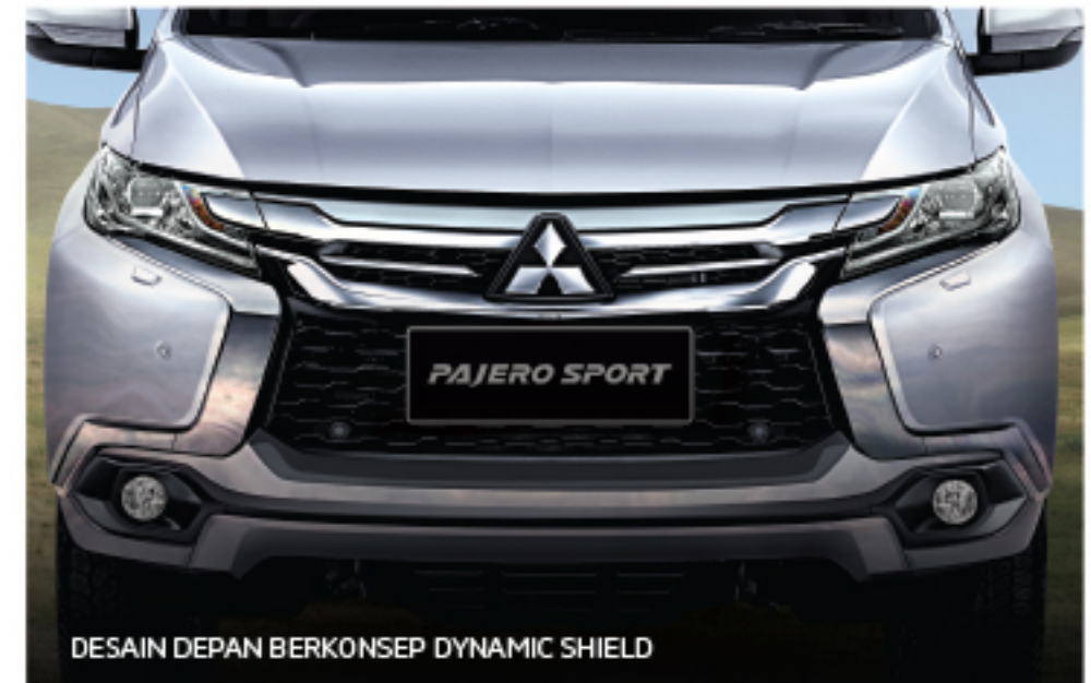
DESAIN DEPAN BERKONSEP DYNAMIC SHIELD