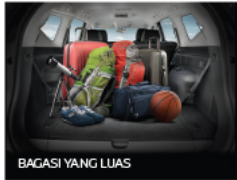
BAGASI YANG LUAS