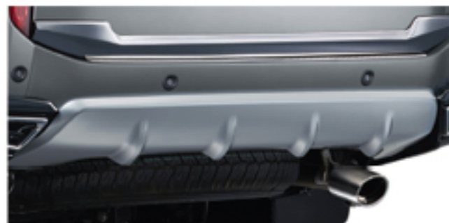
REAR UNDER GARNISH